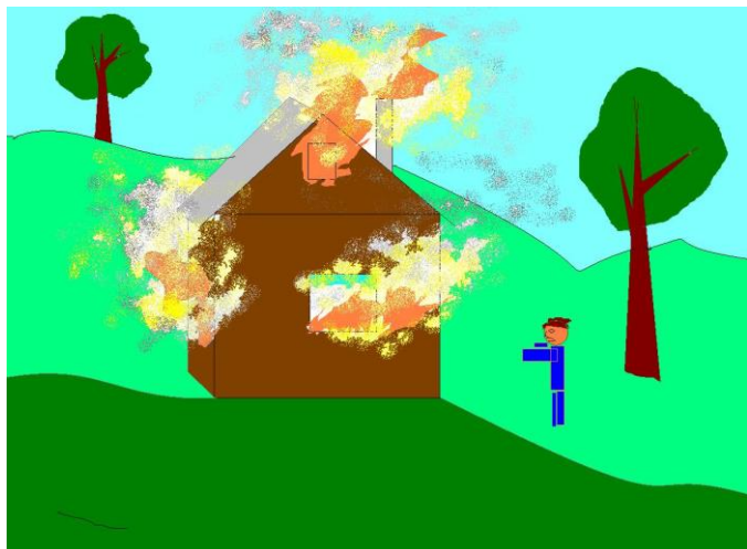
Брагин Алёша 7 кл.